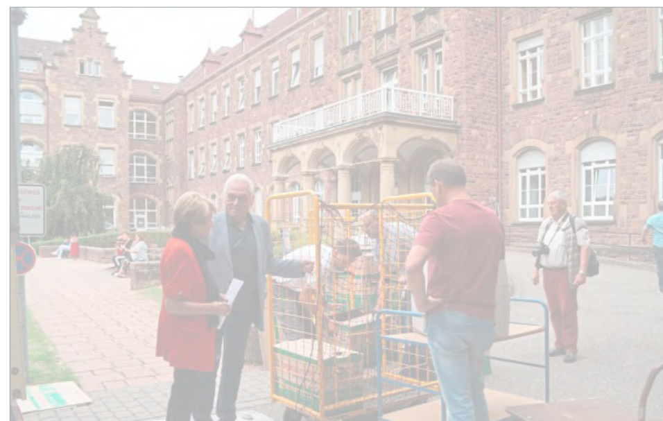
AM KLINIKUM IN KARLSRUHE haben die Parabutscher die ausgerangierte Medizintechnik abgeholt und verpackt.

Auf dem Rückweg nach Bad Schönborn wurden die Rollatoren und weitere Hilfsmittel in der DRK-Zentrale in Grötzingen verladen.